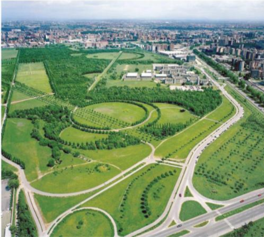
Vue aérienne du Parco Nord

Dans ces dernières années, la nécessité de conjuguer la valorisation des ressources et des potentialités de la communauté de Bresso devient urgente (Parco Nord, le secteur productif et artisanal et petite moyenne entreprise, Centre de Recherches) avec les opportunités offertes par l'intégration des processus de développement de l'aire plus vaste du territoire qui l'entoure.