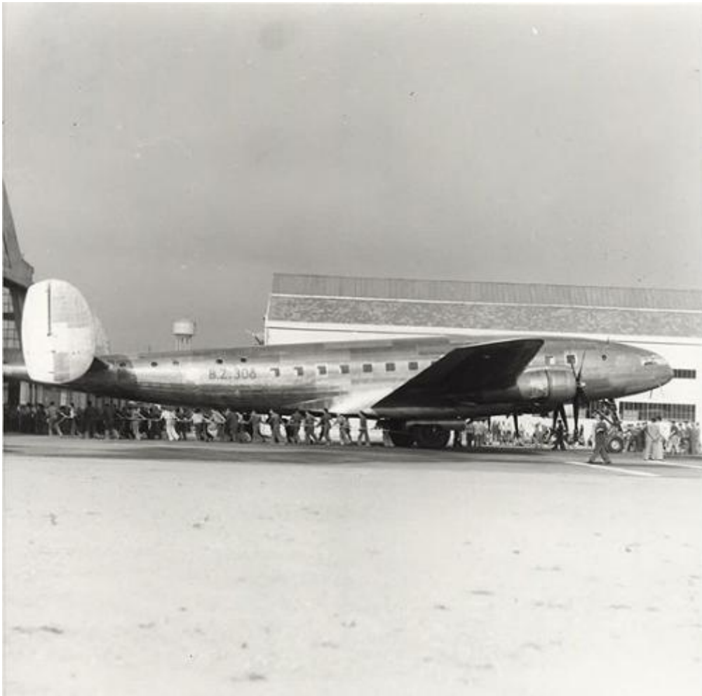
Aéroport de Bresso: quadrimoteur BZ 308

Les partisans de Bresso morts pendant la résistance sont sept.