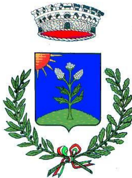
L'emblème de la Commune de Bresso.

Bresso devient fief des Comtes Patellani , une ancienne famille de descendance romaine, établie à Milan au XVIème siècle. Comme souvenir du fief, la couronne est restée sur l' emblème actuel municipal.