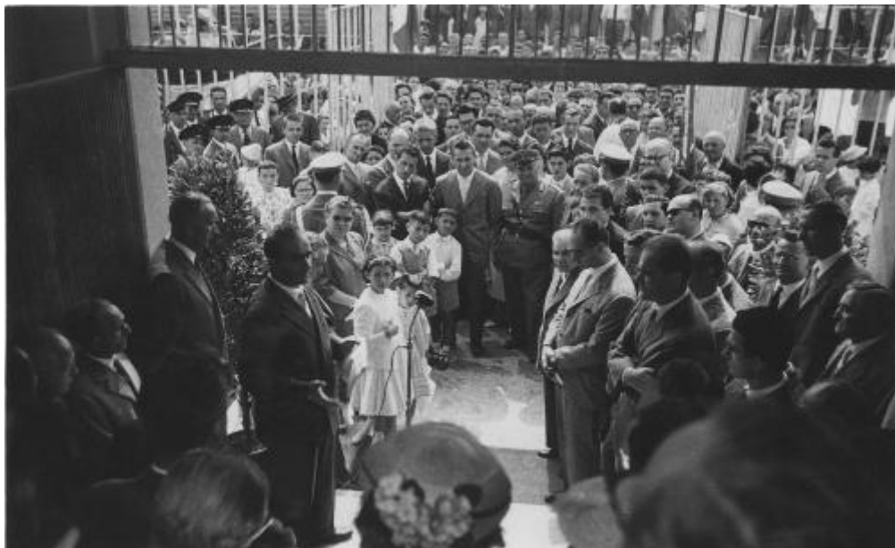
Inauguration de l'école de la rue Lurani

A côté de l'ancienne école de la rue Centurelli qui sera réutilisée comme école de l'enseignement secondaire, naissent les établissements de la rue Lurani en 1958, de la rue Villoresi en 1963, de la rue Don Sturzo en 1966 et de la rue Bologna en 1969.