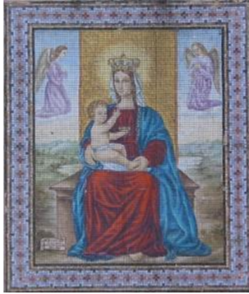
Mosaïque sur la façade de l'Oratoire de la Madonna du Pilastrello