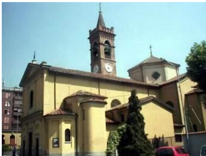
La Paroisse des SS. Nazaro e Celso