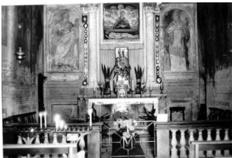
Oratoire de la Bienheureuse Vierge Marie delle Grazie dit "le Pilastrello"

La dévotion envers la Madone du Pilastrello ne cesse d'augmenter avec le temps et les attestés des grâces accordées sont nombreux.