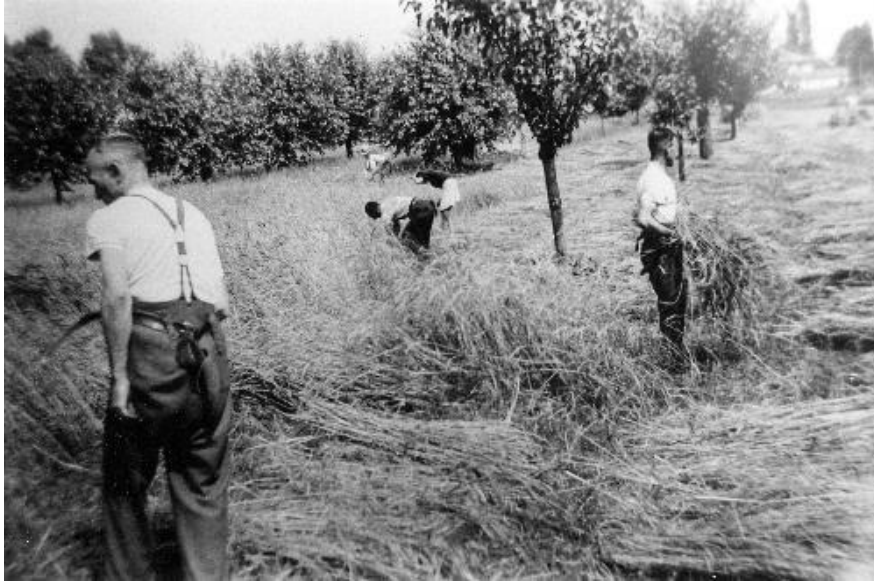
Paysans de Bresso

La plus grande partie du pays est composée de cours concentrées dans les rues Manzoni, della Chiesa (maintenant rue Roma), vicolo della Chiesa, rue Centurelli , et de quelques fermes en direction de Bressin et du Chateau, aux alentours de l'actuelle entrée de rue Lurani et vers la rue per Sesto (la Cassinetta).