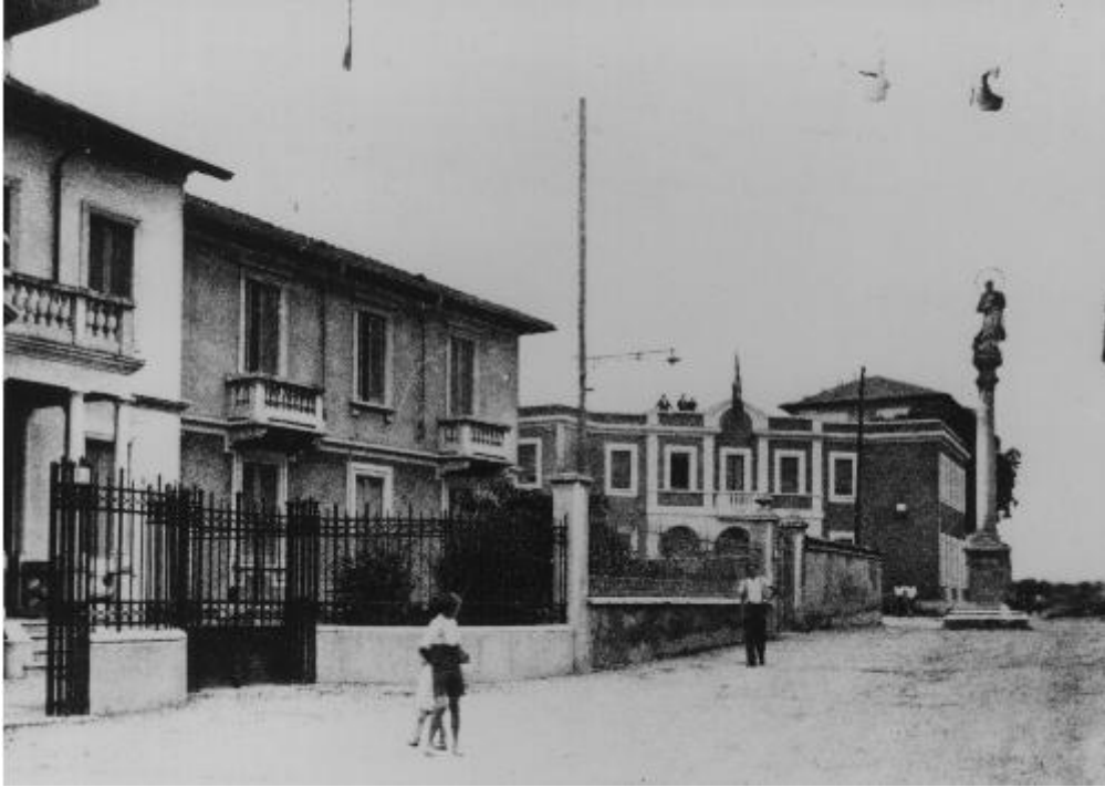
La statue de la Madonna Immacolata à son emplacement d'origine

A l'an 2001, la population résidente est 27.037 habitants au recensement.