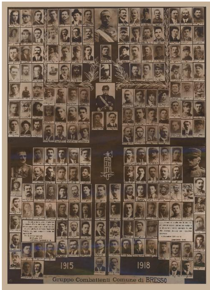
Composition photographique des combattants de bresso de la Première Guerre Mondiale

En 1924, on installera devant la mairie de Rue Vittorio Emanuele (actuelle rue Centurelli) un monument en mémoire des morts de la grande guerre et on inaugure le boulevard delle Rimembranze.