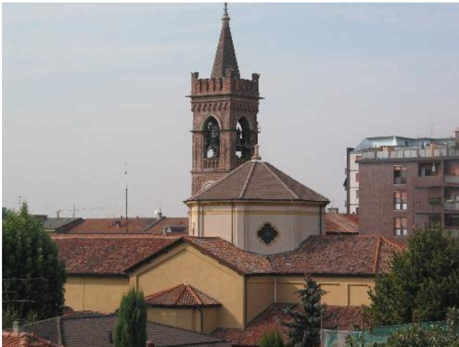
L' Eglise des SS. Nazaro et Celso