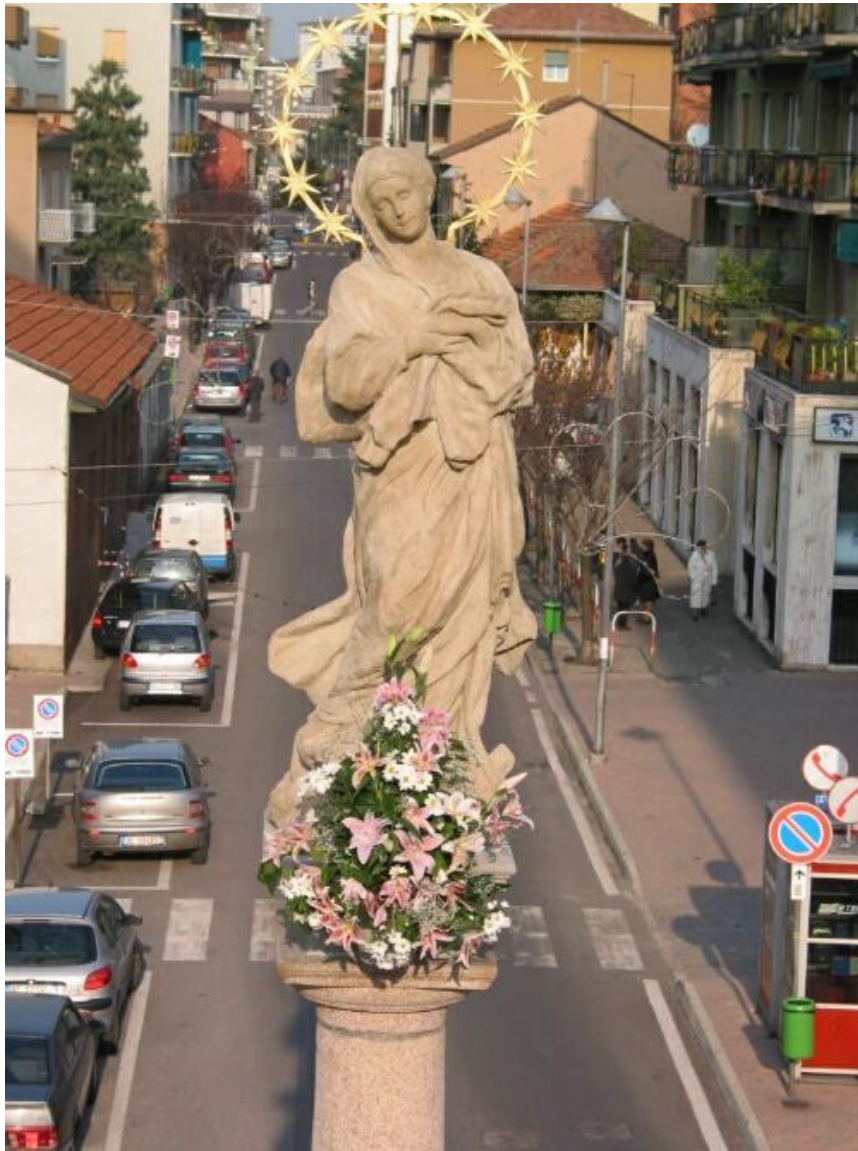
La statue de la Madonna Immaculée après la restauration

Le 30 décembre, le Président Carlo Azeglio Ciampi nomme Febo Conti Grand Officier du mérite de la République pour son activité artistique adressée principalement aux jeunes.