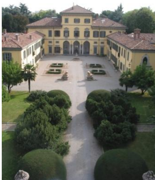
Villa Rivolta (Villa Patellani)

Villa Patellani, résidence d'été de la famille, est une villa typique du dix-huitième siècle lombarde, refaite sur une construction du XVIème siècle dont il n'y a pas de traces. La Villa Patellani sera achetée en 1939 par le commandeur Rivolta, en changeant le nom en Villa Rivolta.